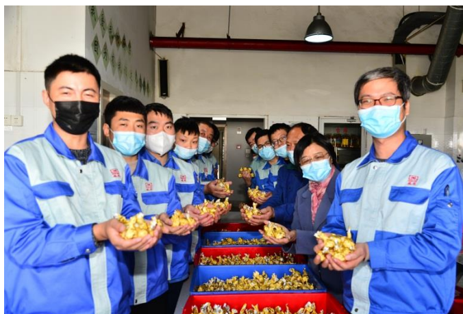
▲三八妇女节，为女同胞制作巧克力

在固锔这个温暖的大家庭里，各支部开展准妈妈、新员工、双职工和退伍军人座谈会；单身青年联谊会；温馨的老乡会；节日送祝福；端午包粽子；中秋写家书，送月饼等活动。